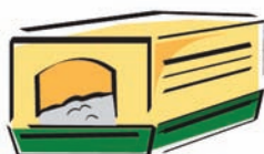
Les litières pour animaux