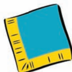
Les mouchoirs en papier et serviettes jetables