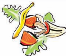
Les ordures ménagères