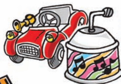
Les jouets en plastique