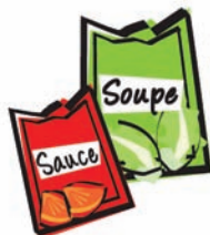
Sachets de sauce et de soupe... Emballages souillés