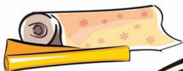
Papiers peints, et papiers cadeaux