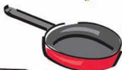
Poêle en métal