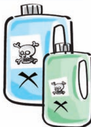
Produits chimiques :