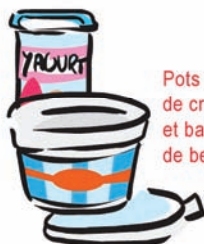
Pots de yaourts, de crème fraîche et barquettes de beurre...