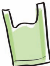
Sac et film plastique